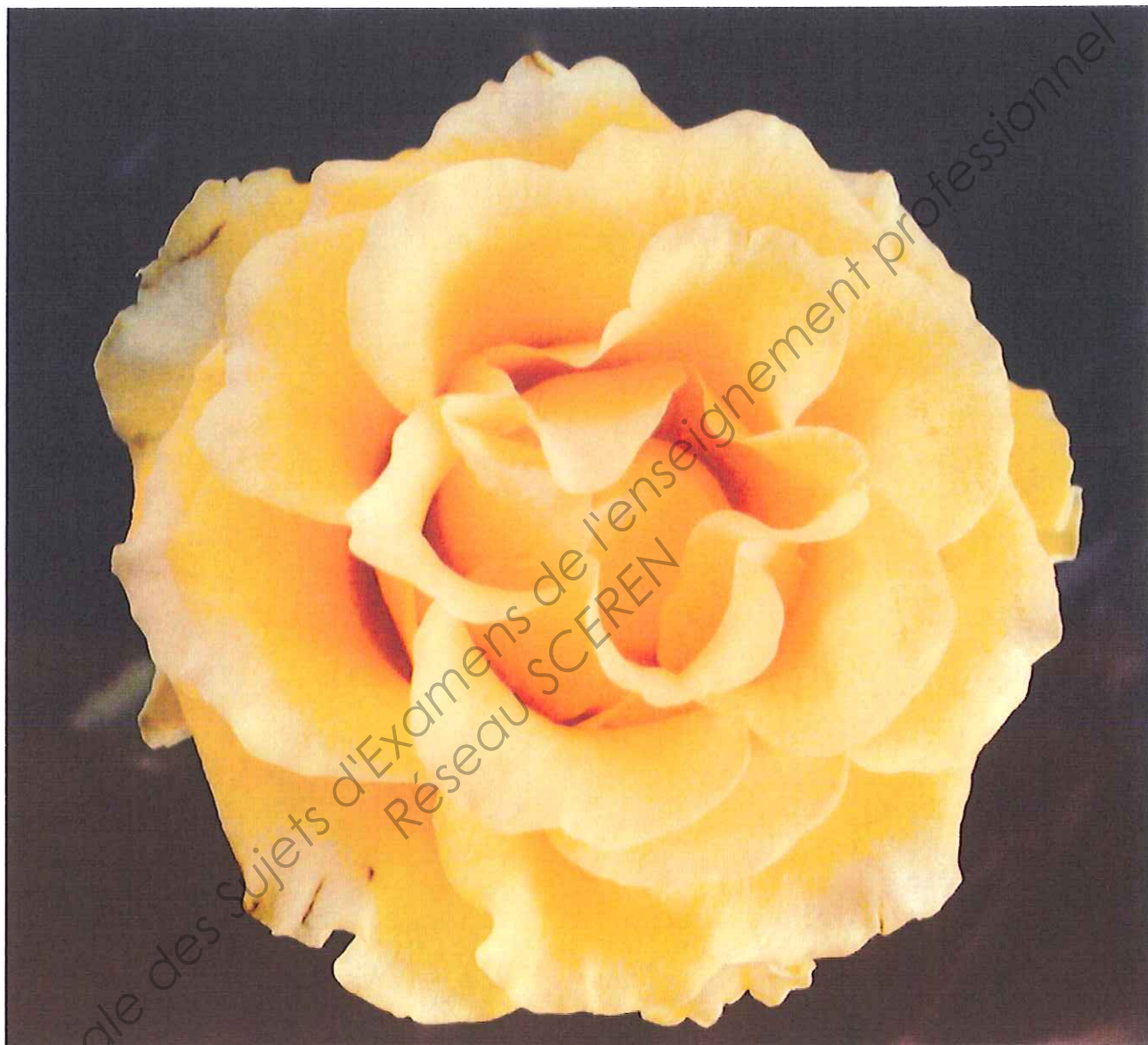
ROSE PRINTEMPS 2010